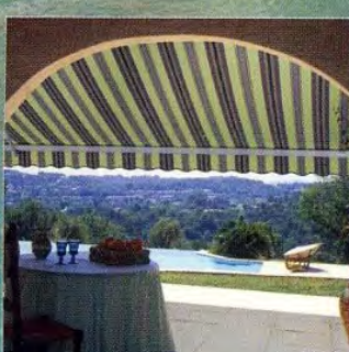
Plans : votre future maison